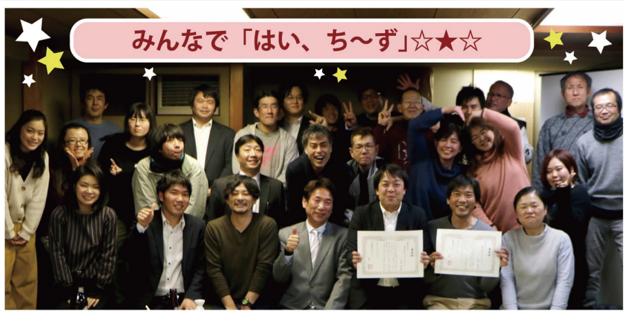
みんなで「はい、ち～ず」☆☆☆

2019年1月12日(土)毎年恒例「社員総会」を行いました。社員の、社員による、社員の為の総会ということで企画から準備、当日の司会進行など、イベント委員会中心となって実施しました。第1部は社長から「今年のテーマ」等をお話いただき、第2部は美味しいお酒とお料理をいただき各賞の授与が行われました！今年4月からの新卒生も駆けつけてくれ、とても和やかな会になりました。