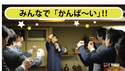
みんなで「かんぱ～い」!!

2019年1月12日(土)毎年恒例「社員総会」を行いました。社員の、社員による、社員の為の総会ということで企画から準備、当日の司会進行など、イベント委員会中心となって実施しました。第1部は社長から「今年のテーマ」等をお話いただき、第2部は美味しいお酒とお料理をいただき各賞の授与が行われました！今年4月からの新卒生も駆けつけてくれ、とても和やかな会になりました。