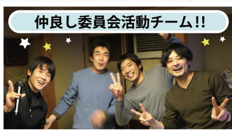
仲良し委員会活動チーム!!