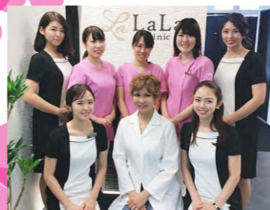
ダーマペン気になる～!

「おもてなしの精神」「効果を追求した技術」「安心価格」を軸に美容医療を身近に感じて頂けるクリニックを目指しています。